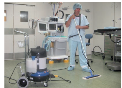
Für Hygiene und Sauberkeit in Krankenhäusern und Arztpraxen.

Dampf-Mopp mit 10 m Schlauch und Baumwoll-Bezügen