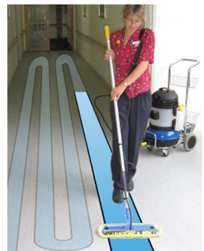
Große Flächen schnell und einfach reinigen mit Dampf.

Passend für Dampfreiniger: GAL, Carmen-Plus-Inox und Steam-Box-Mini.